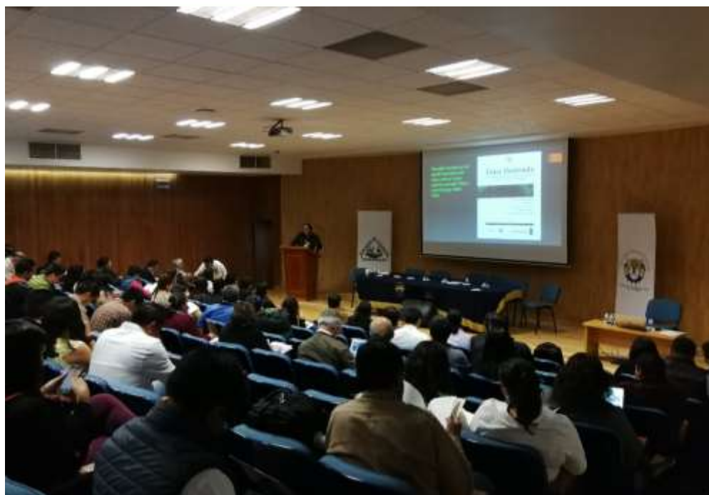
Fig. 2. Presentación del Libro “Guía Ilustrada para identificar las especies del género Dendroctonus , presentes en México y Centroamérica”