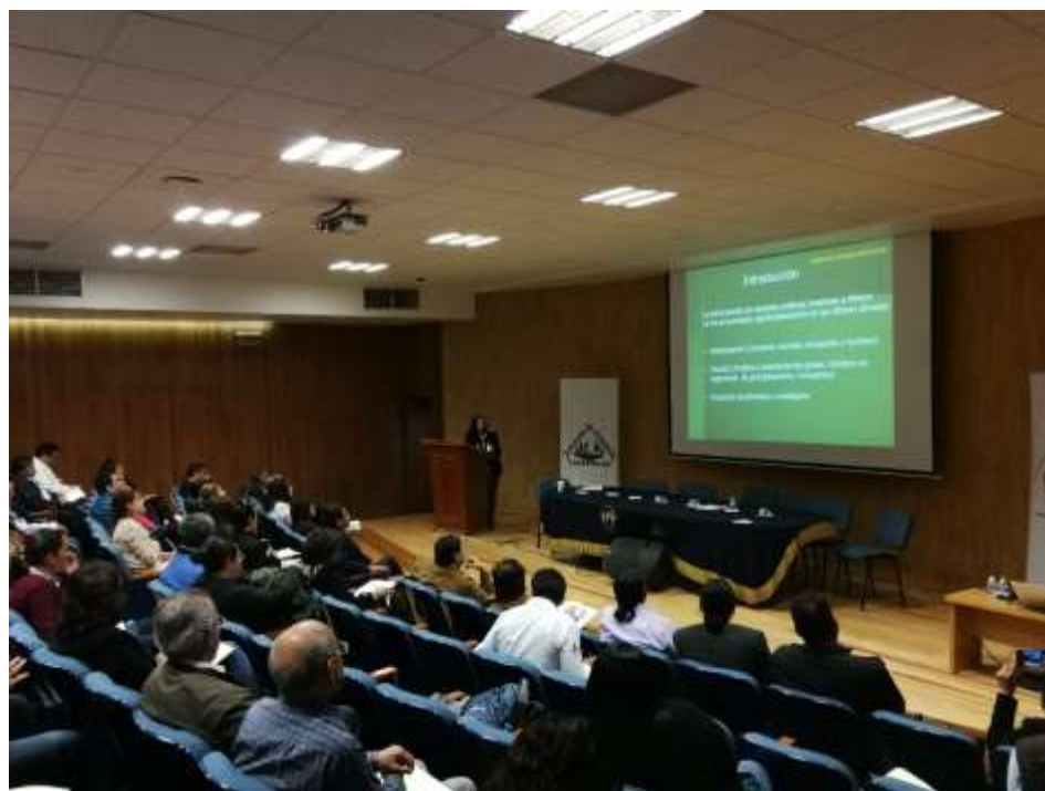
Fig. 6. Presentación de avances de la línea Plagas exóticas