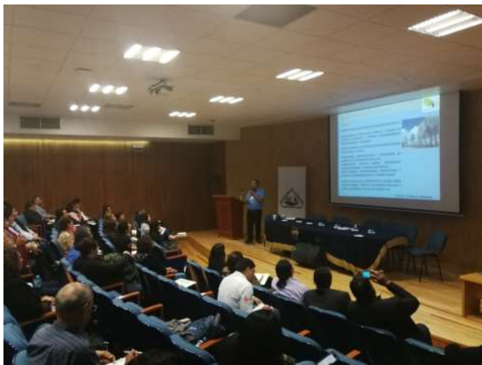
Fig. 7. Presentación de avances de la línea Nuevas técnicas de Control de Plagas