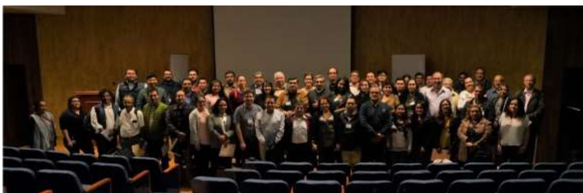
Fig. 10. Asistentes del Foro