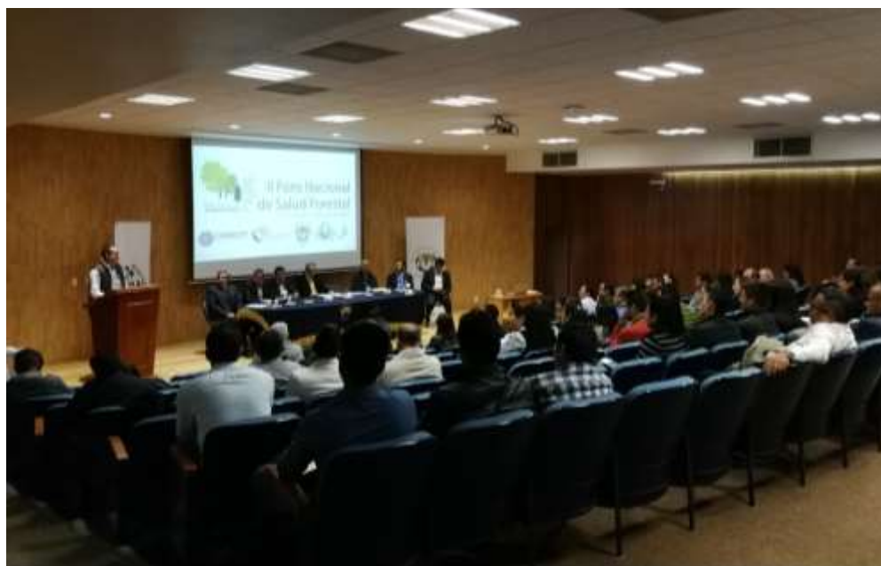
Fig. 1. Inauguración del curso por Gaudencio Benitez Molina