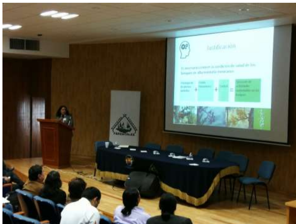
Fig. 4. Presentación de avances de la línea Plantas Parásitas