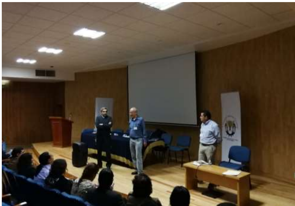
Fig. 8. Clausura del Foro