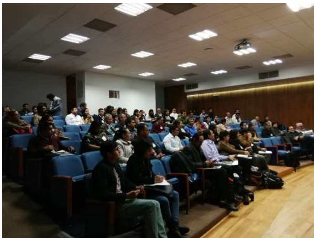
Fig. 9. Asistentes del Foro