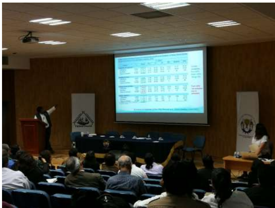
Fig. 5. Presentación de avances de la línea Monitoreo de la Salud Forestal