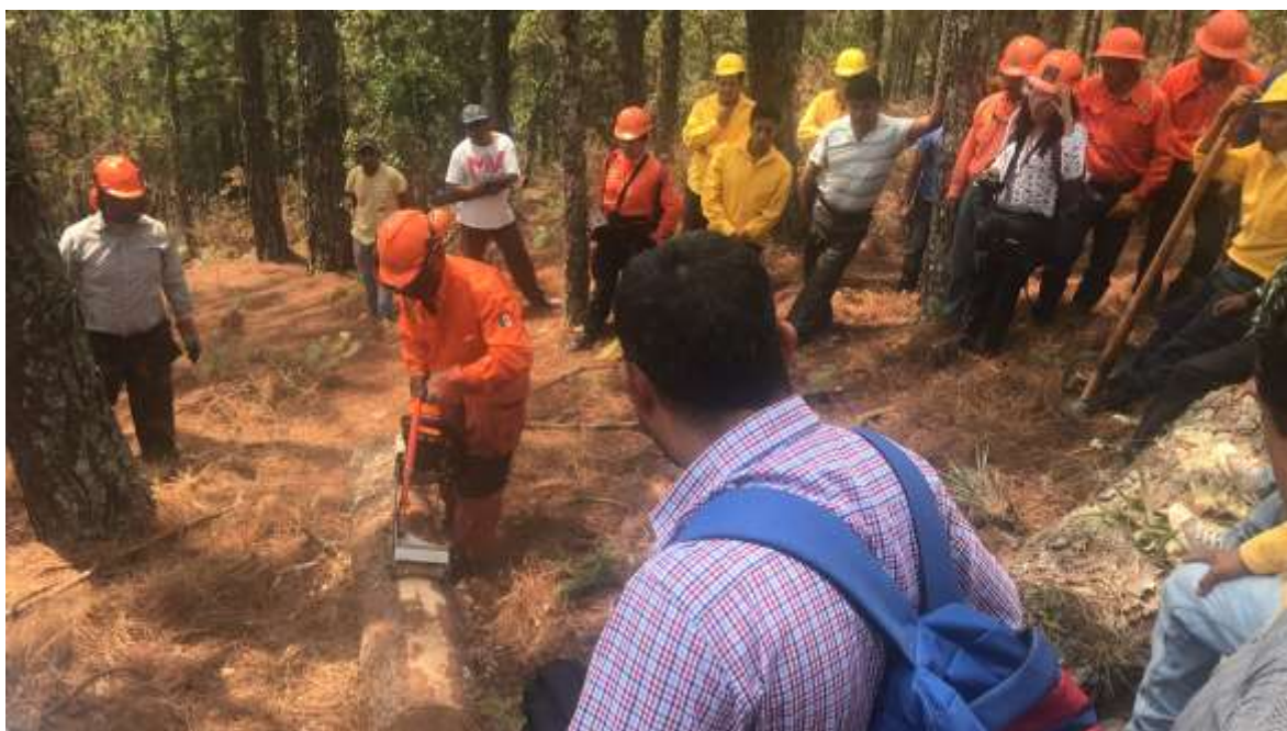
Fig. 25. Práctica de descortezado en campo.