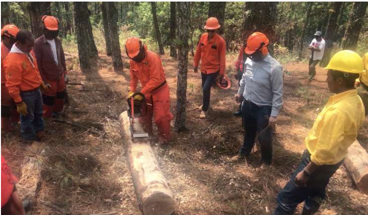
Fig. 28. Práctica de descortezado en campo.