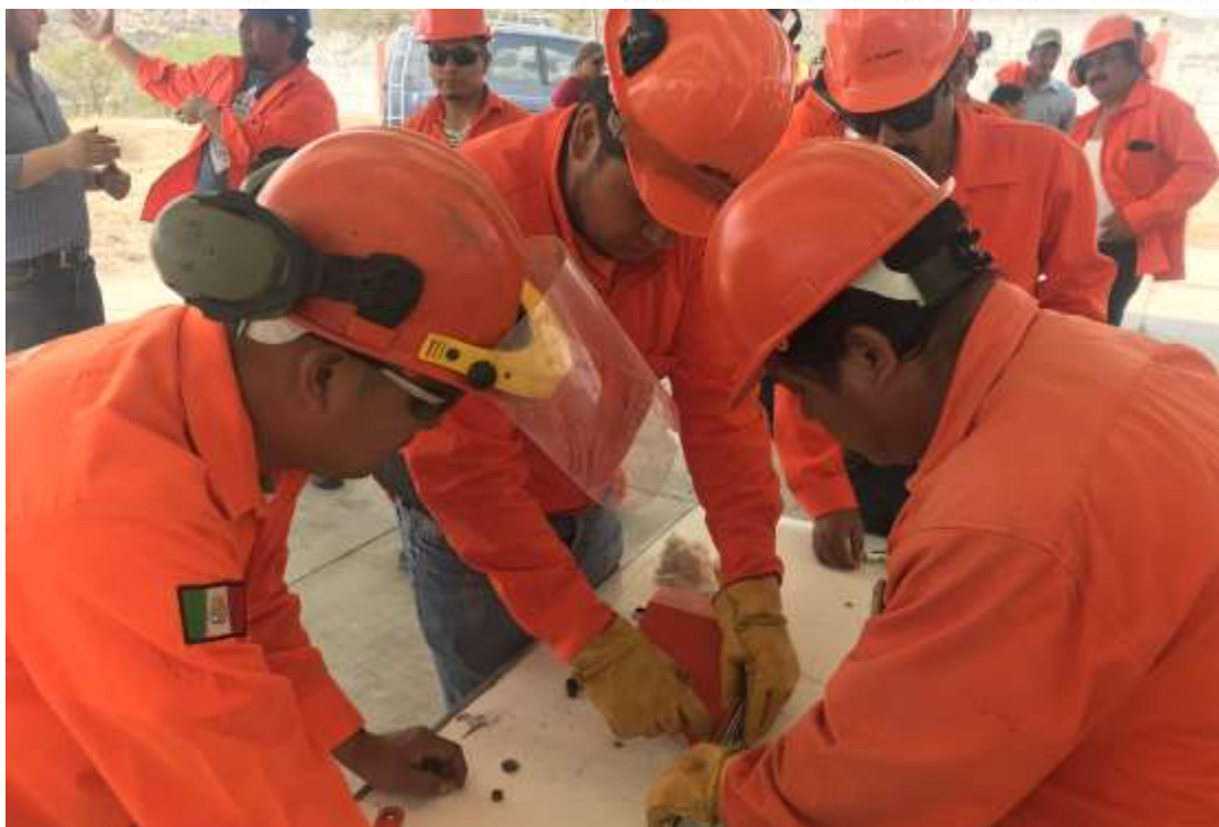
Fig. 37. Práctica de montaje del implemento