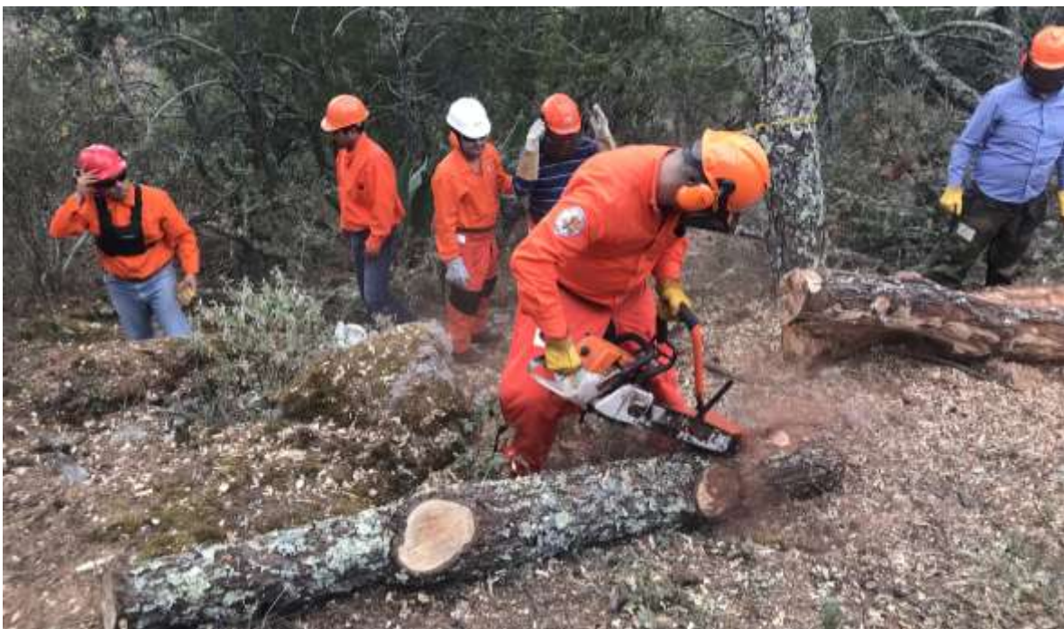
Fig. 40. Práctica de descortezado en campo.