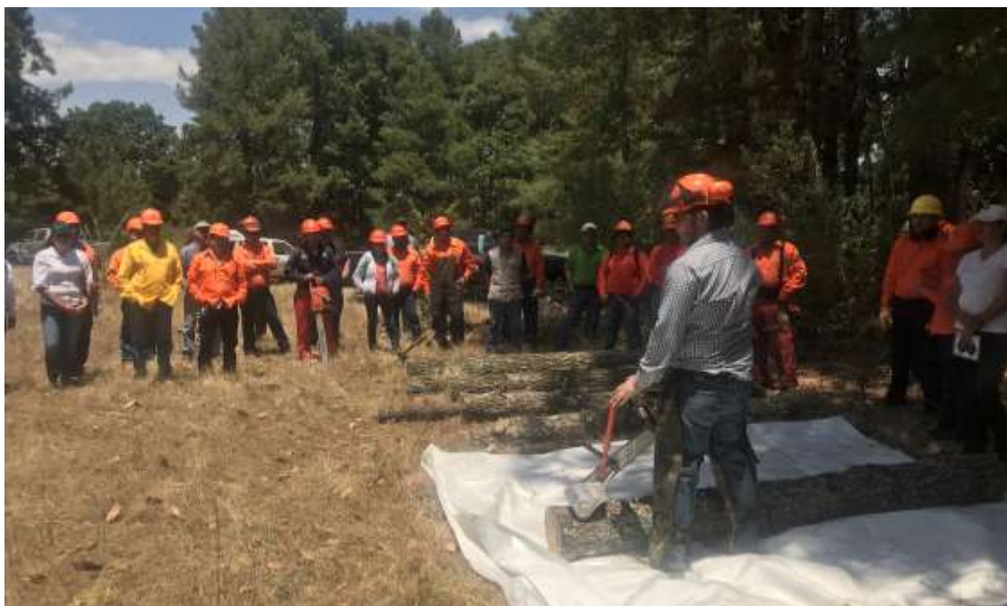
Fig. 5. Indicaciones del uso de la “Garra de Oso”