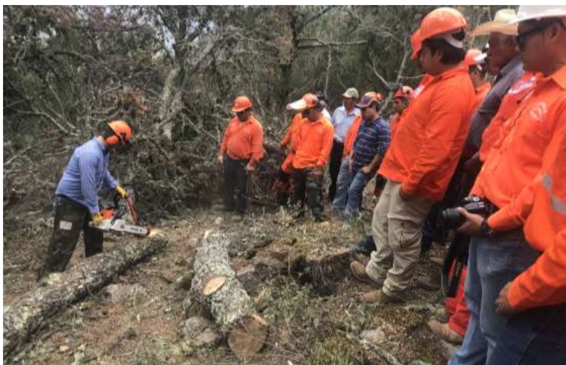
Fig. 38. Práctica de descortezado con la Garra de Oso