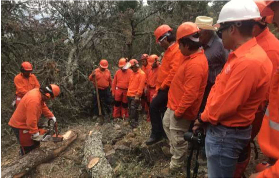
Fig. 41. Práctica de descortezado en campo.