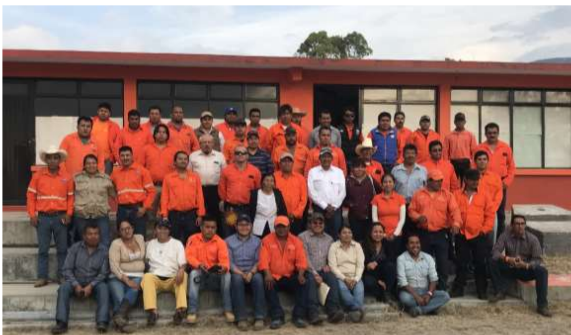
Fig. 46. Asistentes del taller de montaje y uso del implemento acoplado a motosierra.