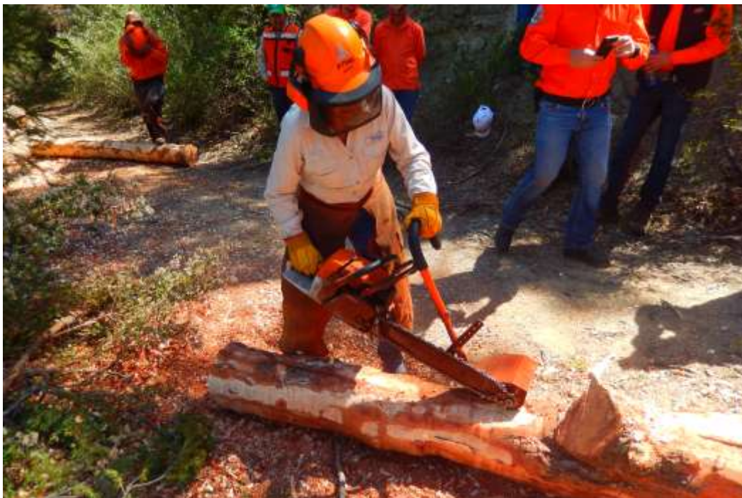
Fig. 19. Práctica de descortezado en campo.