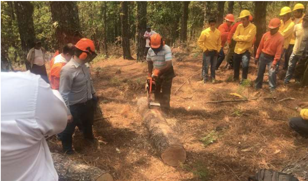
Fig. 27. Miembro del ejido probando el descortezado con la Garra de Oso