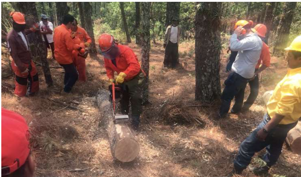
Fig. 29. Práctica de descortezado en campo.