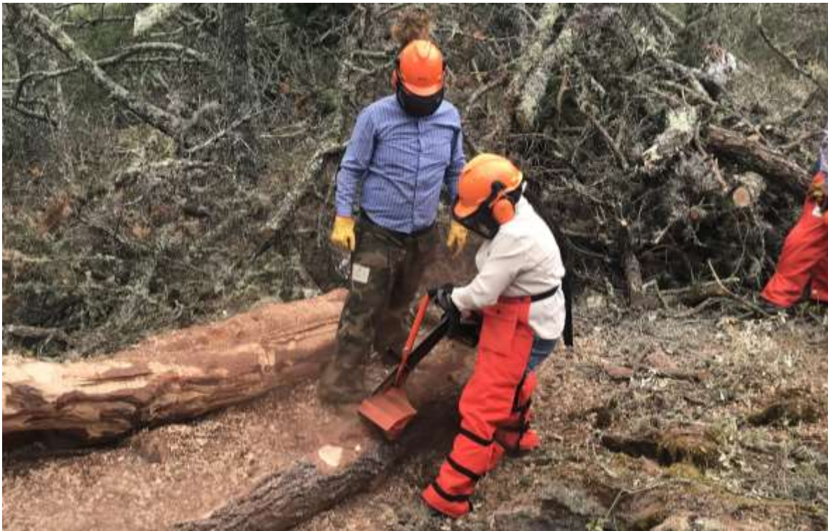
Fig. 42. Práctica de descortezado en campo.