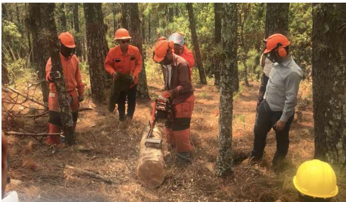
Fig. 30. Práctica de descortezado en campo.