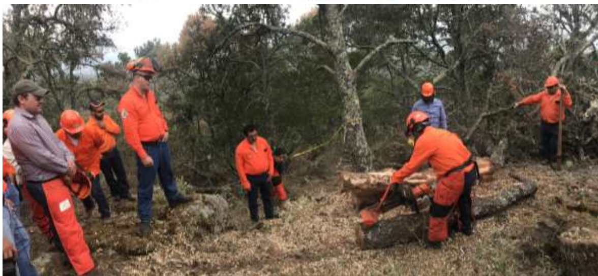
Fig.43. Práctica de descortezado en campo.