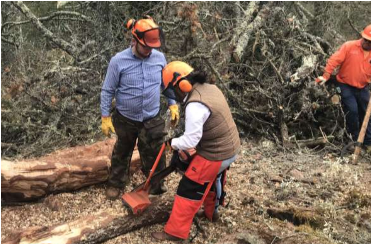
Fig. 39. Práctica de descortezado en campo.