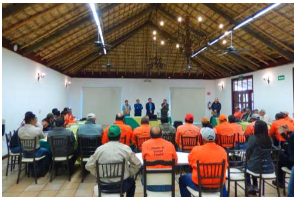
Fig. 13. Inauguración del taller por parte del Gerente de Coahuila.