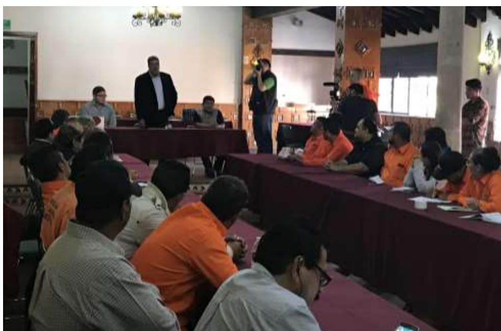
Fig. 2. Inauguración del curso a cargo del Gerente de Michoacán