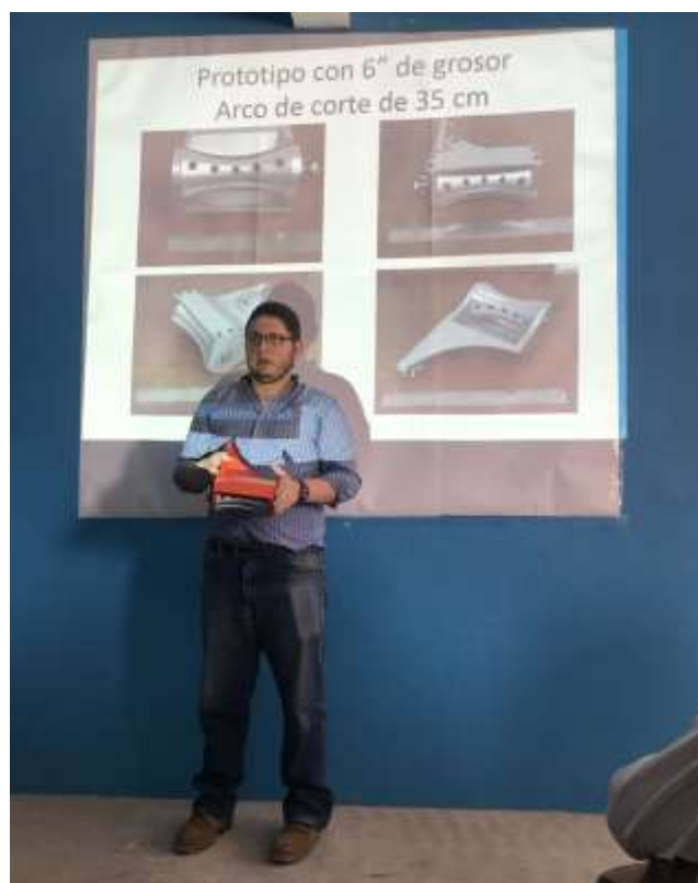
Fig. 35. Presentación del prototipo y descripción de mejoras