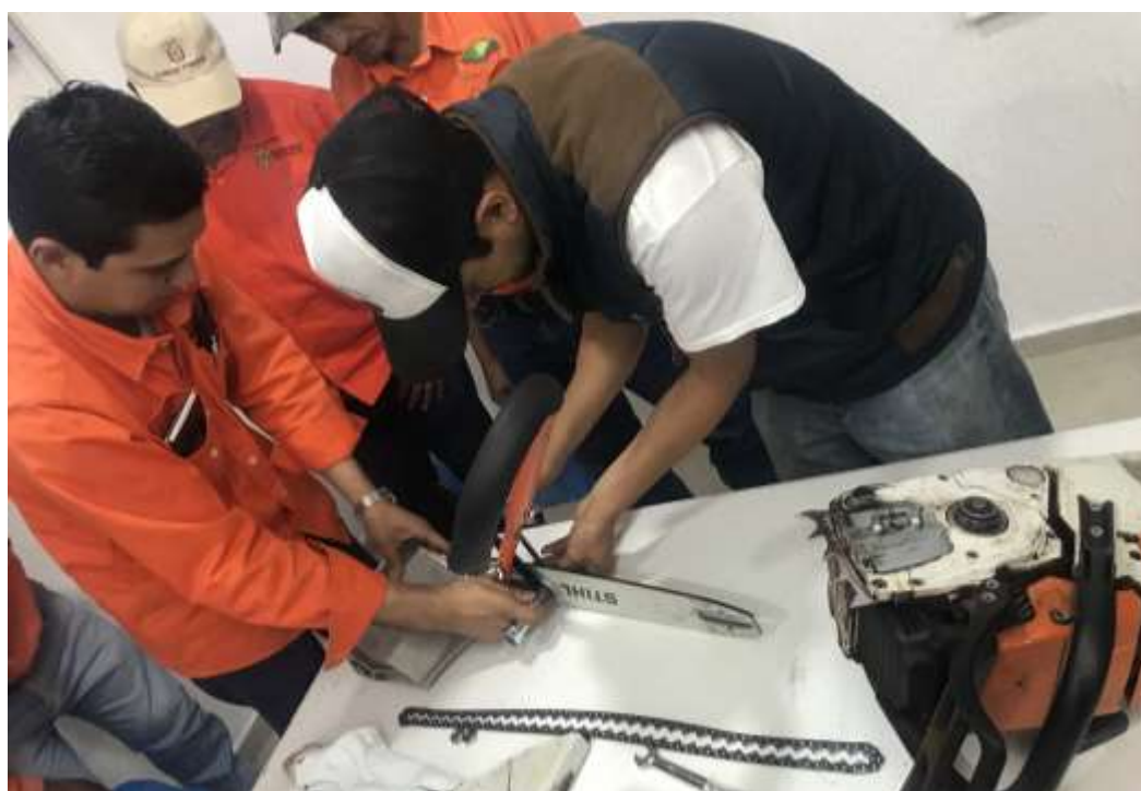
Fig. 24. Práctica de montaje de la descortezadora mecánica "Garra de Oso"