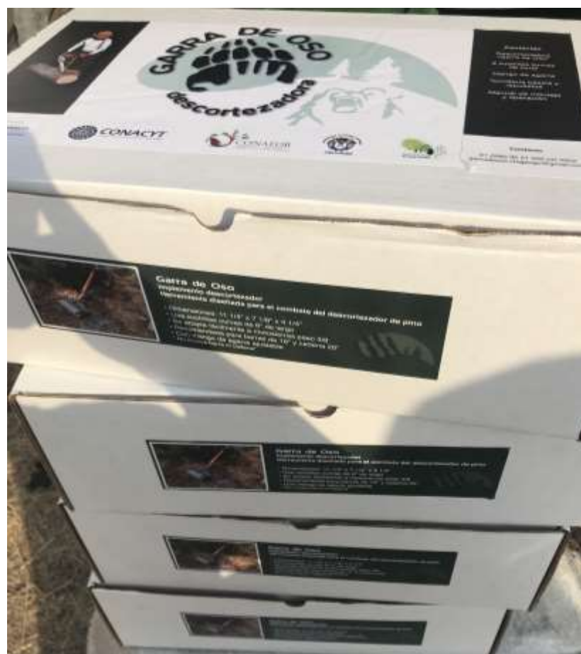
Fig. 44. Entrega de descortezadoras.