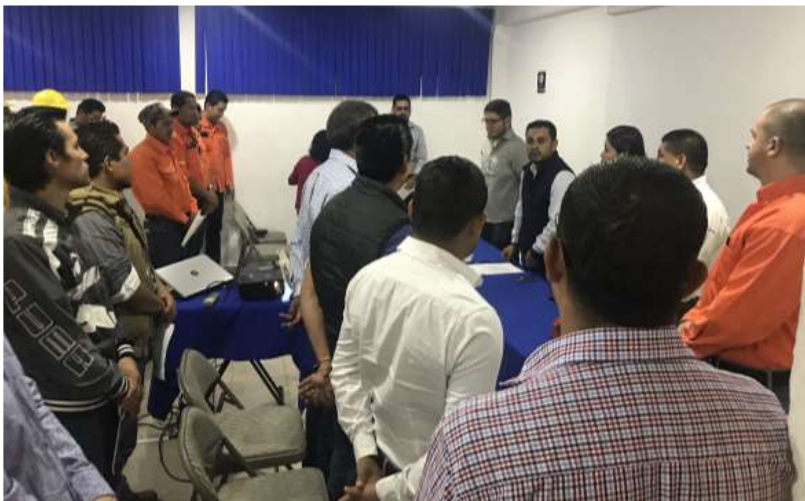
Fig. 21. Inauguración del taller por parte del Gerente de Guerrero