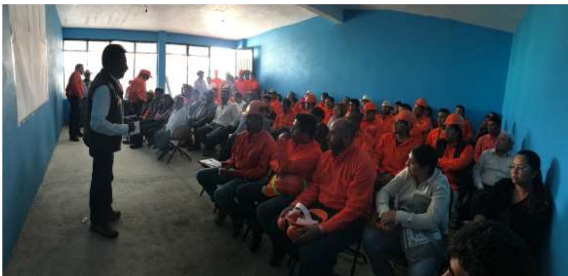
Fig. 33. Inauguración del taller por parte del Gerente de Hidalgo