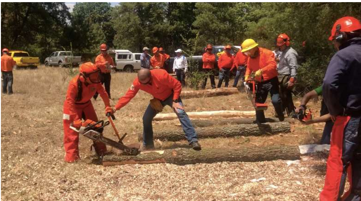
Fig. 8. Práctica de descortezado con la Garra de Oso