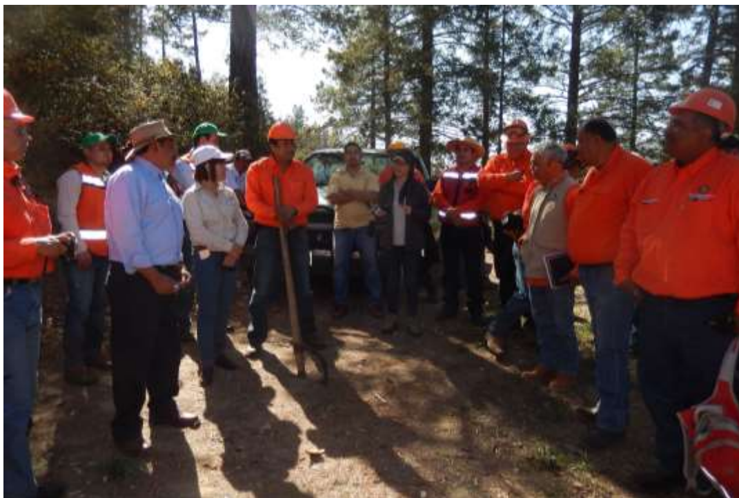
Fig. 20. Clausura del taller e intercambio de opiniones.