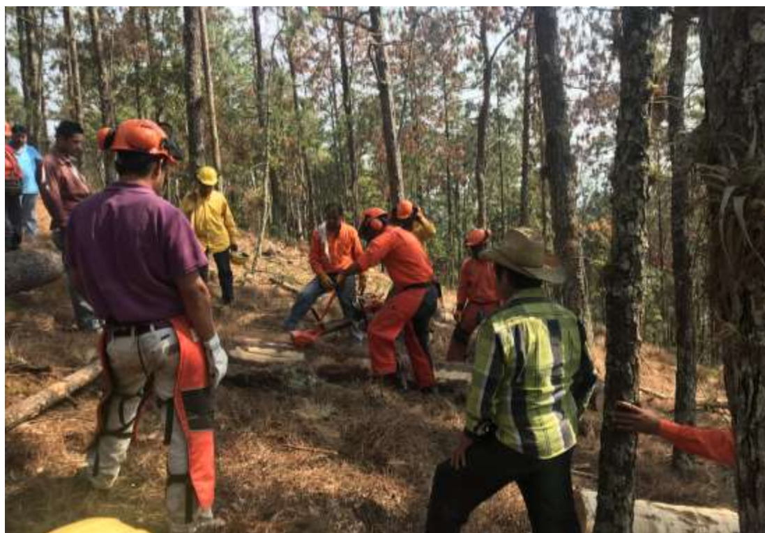
Fig. 26. Práctica de descortezado en campo.