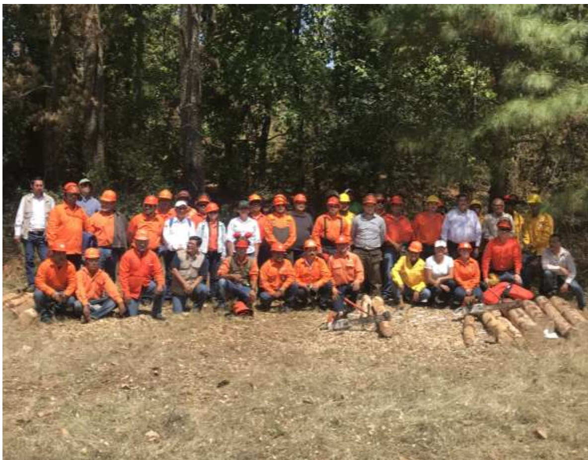
Fig. 12. Asistentes del taller de montaje y uso del implemento acoplado a motosierra