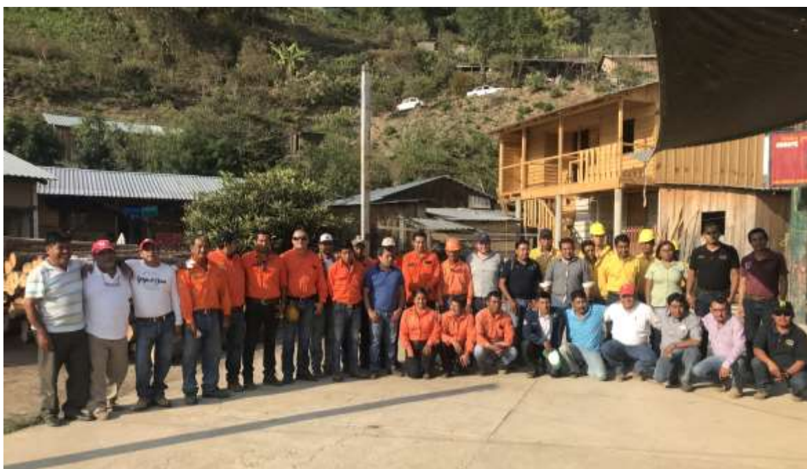
Fig. 32. Asistentes del taller de montaje y uso del implemento acoplado a motosierra