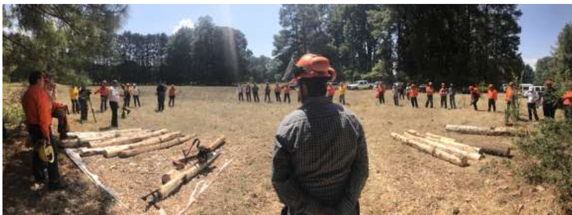
Fig. 11. Clausura del curso a cargo del Gerente de Michoacán