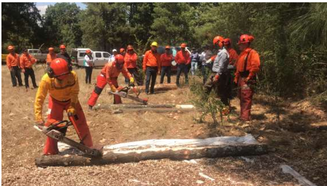
Fig. 6. Práctica de descortezado en campo.