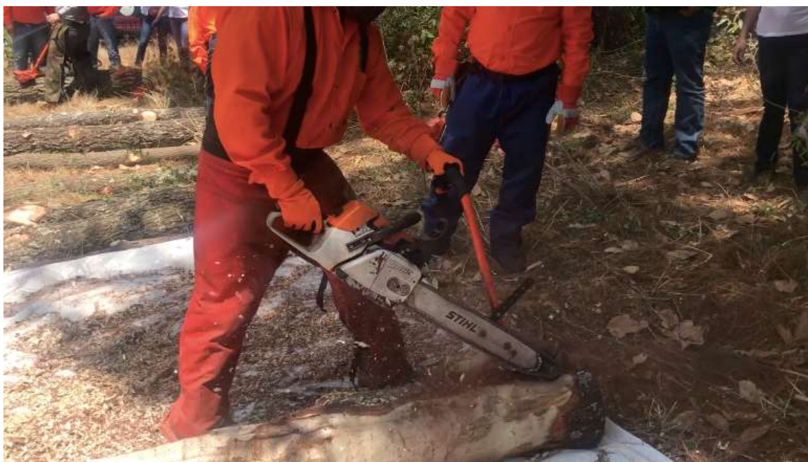
Fig. 10. Práctica de descortezado con la Garra de Oso