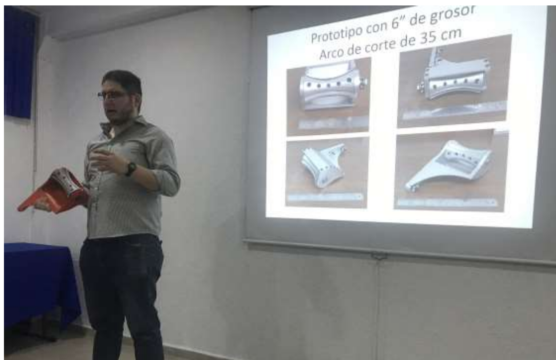
Fig. 23. Presentación del prototipo y descripción de mejoras