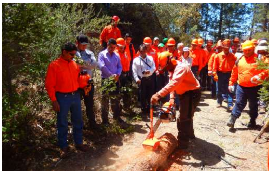
Fig. 16. Práctica de descortezado en campo.