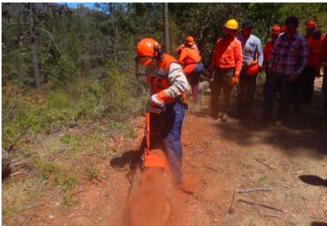
Fig. 17. Práctica de descortezado en campo.