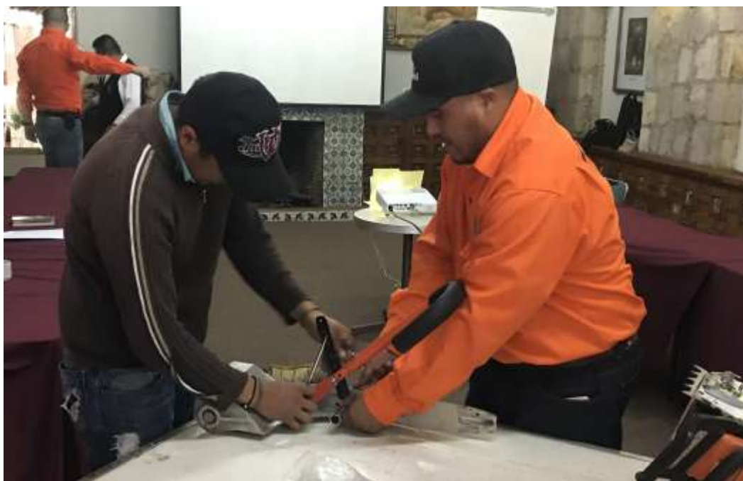
Fig. 4. Práctica de montaje de la descortezadora mecánica “Garra de Oso”