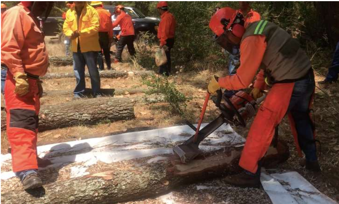
Fig. 7. Práctica de descortezado con la Garra de Oso