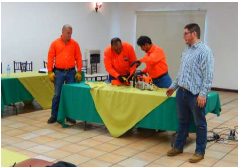
Fig. 15. Práctica de montaje