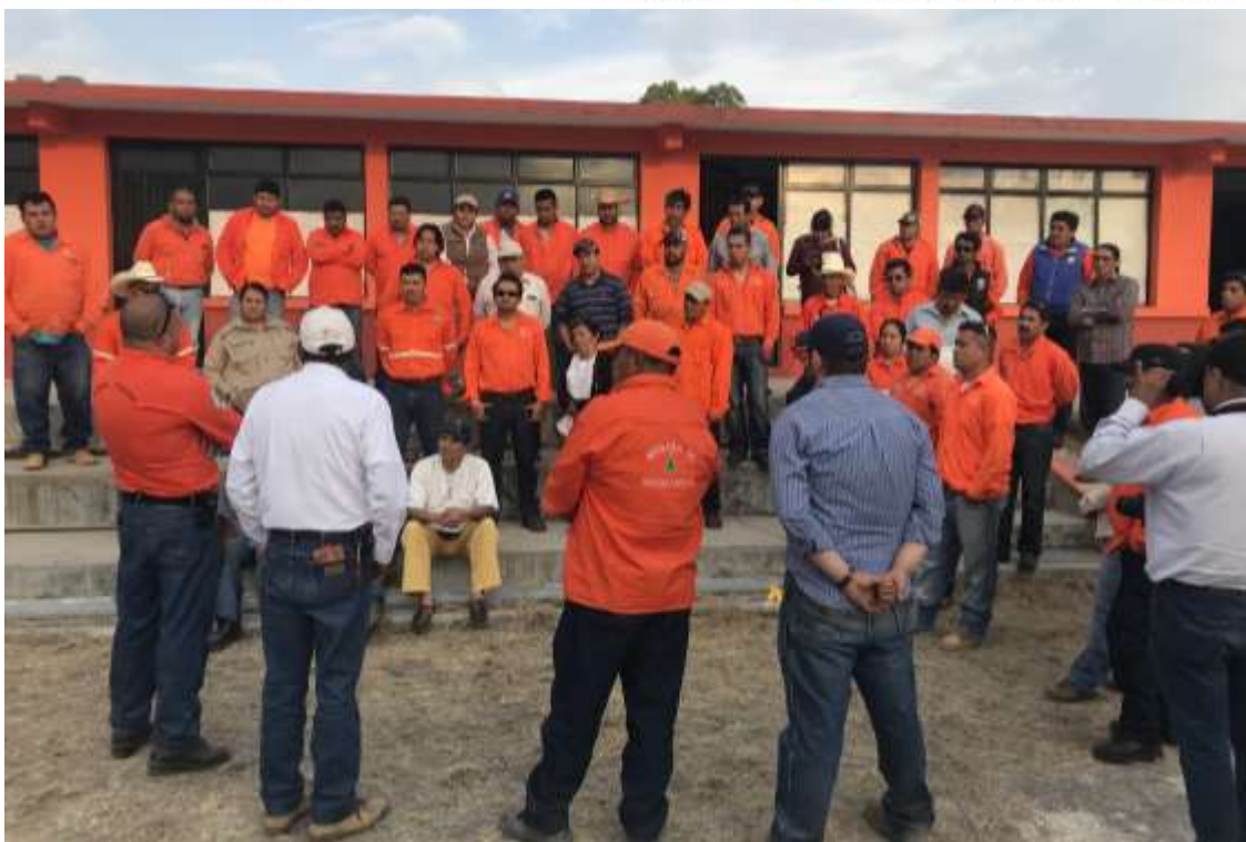
Fig. 45. Clausura del Taller e intercambio de opiniones