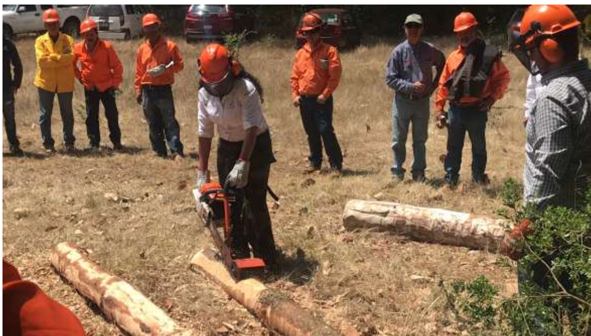
Fig. 9. Práctica de descortezado en campo.