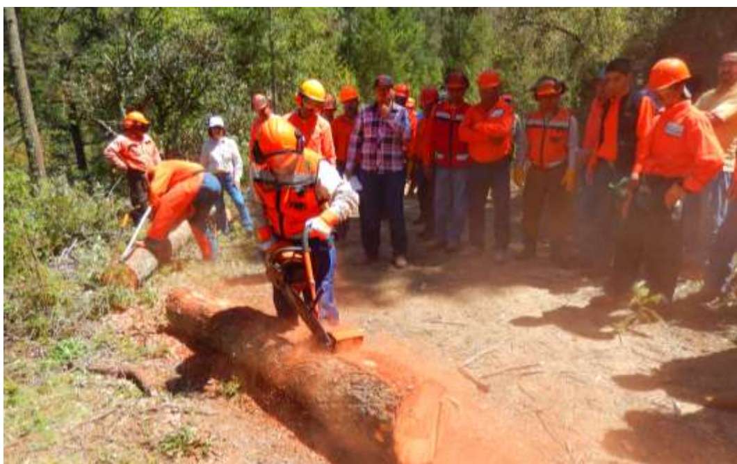
Fig. 18. Práctica de descortezado en campo.