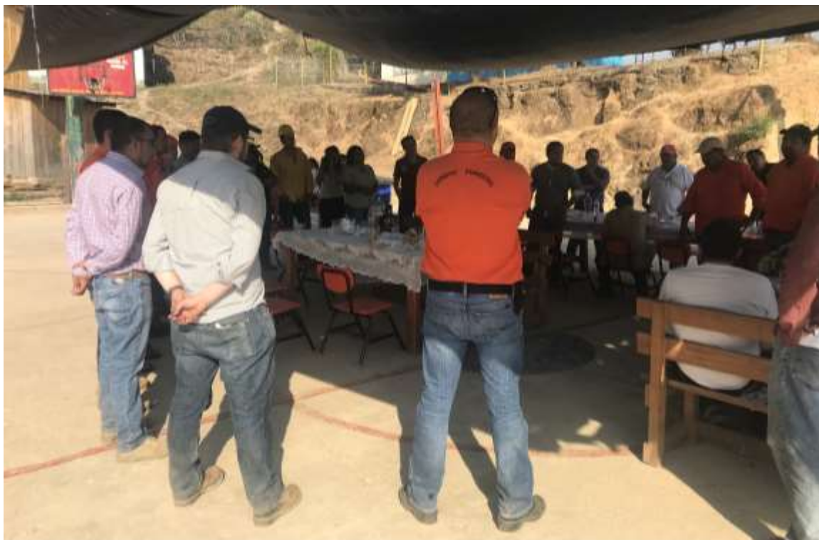
Fig. 31. Clausura del taller e intercambio de opiniones