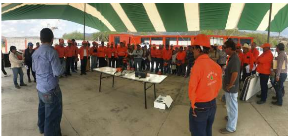
Fig. 36. Práctica de montaje del implemento